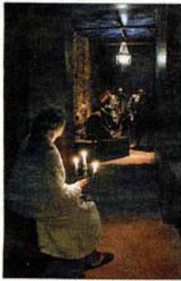
Escena de Este sol de la infancia .

habla de éxodos, de perdedores, de exilios interiores y exteriores. Sitúa la acción en la pensión de Colliure (Francia) en la que pasaron sus últimos días Antonio Machado y su madre Ana Ruiz, quien muere tres días después que el poeta. El título de la obra es el último verso del poeta sevillano. Calonge y La Pajarita de Papel no narran hechos históricos. Solo aprisionan la atmósfera de aquellos días dentro de un teatro poético, manierista, sobrio, de profundo calado y magníficamente interpretado.